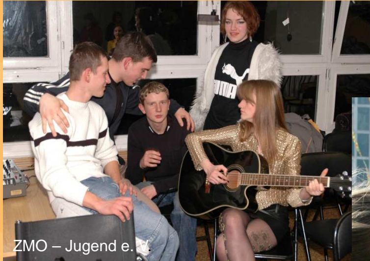
ZMO – Jugend e.