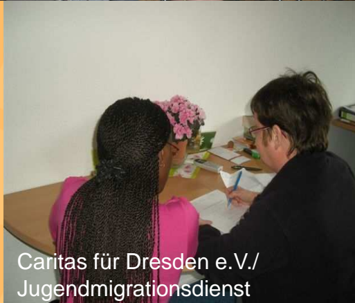
Caritas für Dresden e.V./ Jugendmigrationsdienst