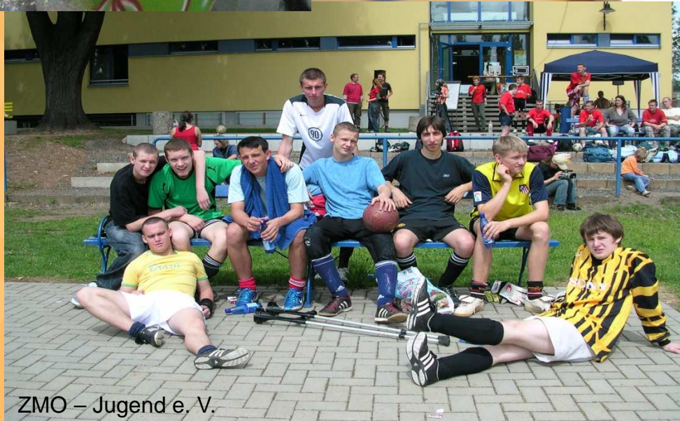
ZMO – Jugend e. V.