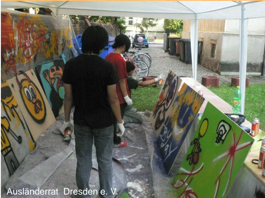
Ausländerrat Dresden e. V.