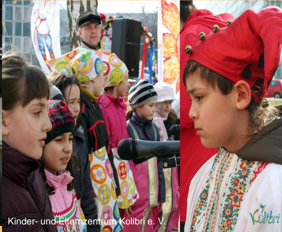
Kinder- und Elternzentrum Kolibri e. V.