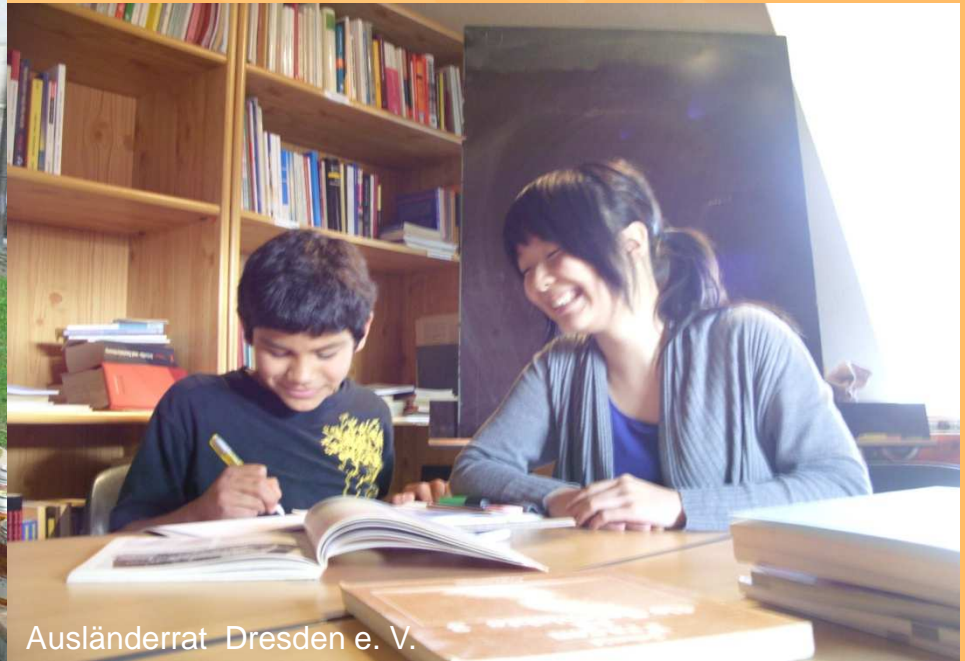
Ausländerrat Dresden e. V.